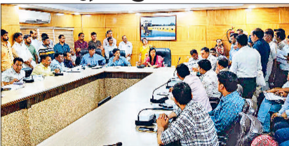
नारनौल। चुनाव ड्यूटी के लिए नियुक्त नोडल अधिकारियों की बैठक लेती डीसी।

लोकसभा आम चुनाव को लेकर वीरवार को उपायुक्त मोनिका गुप्ता ने चुनाव ड्यूटी के लिए बनाए गए सभी नोडल अधिकारियों की बैठक ली। इस दौरान उन्होंने अधिकारियों को आवश्यक दिशा निर्देश जारी किए। डीसी ने कहा कि निष्पक्ष व शांतिपूर्ण चुनाव संपन्न करवाना हम सब की जिम्मेदारी है। फिलहाल सभी कार्यालय के मानव संसाधन व मशीनों संसाधन का उपयोग केवल चुनावी कार्य के लिए किया जा रहा है। इस संबंध में कार्यालयों से जो भी डिटेल्स मांगी गई है उसको सही तरीके से उपलब्ध कराया जाए। कोर्ट नोडल अधिकारी अथवा लापरवाही करेगा तो उसके खिलाफ