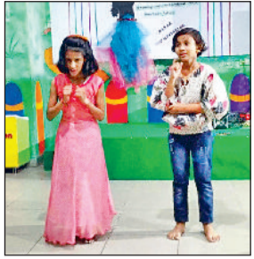
महेन्द्रगढ़। कार्यक्रम में अपनी प्रस्तुति देती छात्राएं।