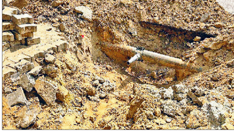
महेंद्रगढ़। जनस्वास्थ्य विभाग द्वारा रेलवे रोड पर पाइप लाइन के लिए खोदा गड्ढा।