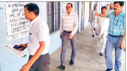
नारनौल। मतदाता जागरूकता कार्यक्रम में भाग लेते विद्यार्थी व कनीना में मतदान केंद्र का निरीक्षण करते अधिकारी।