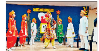
नारनौल। सांस्कृतिक कार्यक्रम प्रस्तुत करते विद्यार्थी।